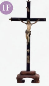
コレジオ祭壇十字架