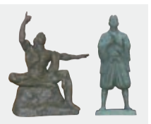
左:平和祈念像の原型(1/20) 右:天草四郎

日本彫塑会の巨匠で、文化勲章を受章した郷土出身の芸術家、北村西望氏の代表作60点を展示しています。西望氏は、長崎平和祈念像の作者として親しまれています。