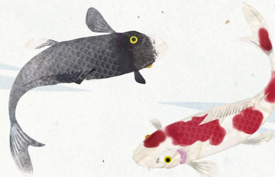
冻米粉制作体验 / 300日元