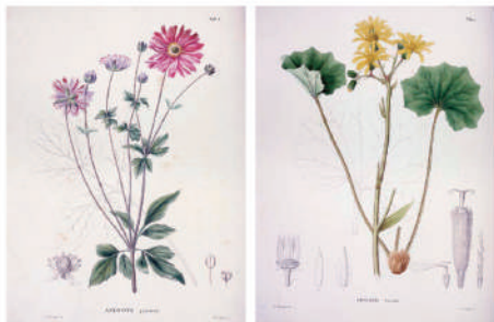
シーボルト『日本植物誌』 シュウメイギク、ツワブキ（所蔵：福岡県立図書館）

2024年は、島原城築城（1624）から400年。これを記念して、島原藩の本草学を起点としたデジタル展覧会「色めく島原花鳥園 - 江戸時代のボタニカル・アートをめぐる」（全4章）を開催します。