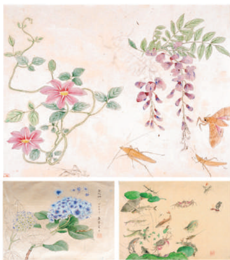
賀来飛霞『動植物写生図』 藤、紫陽花、睡蓮（所蔵：大分市歴史資料館）