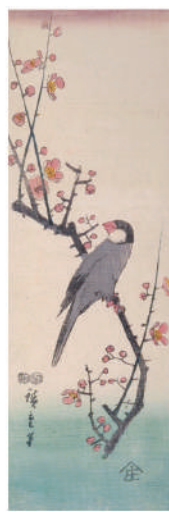
右図 | 歌川広重『花鳥錦絵』 梅に文鳥（所蔵：国立国会図書館）