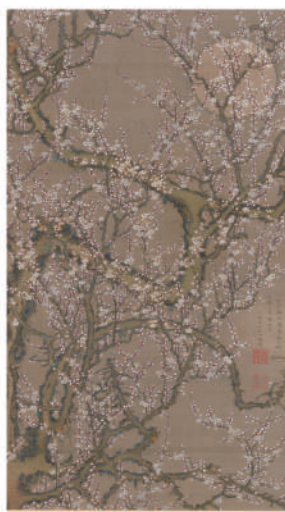
左図 | 伊藤若冲《月梅園》（所蔵：メトロポリタン美術館）